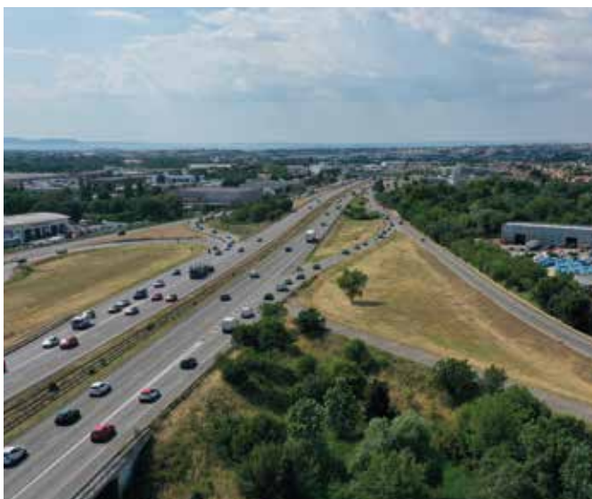
Des engorgements fréquents dans le tunnel de Mirabeau

➔ Depuis Marseille, les autoroutes du Nord (A7) ou du Littoral (A55) convergent en amont du tunnel de Mirabeau. Dès la sortie du tunnel, l'échangeur N°30 dit de l'Agavon, propose deux sorties consécutives rapprochées pour desservir les communes de Vitrolles, Marignane, Saint-Victoret et Les Pennes Mirabeau. Ces communes abritent de très importantes zones d'activités économiques, fortes de dizaines de milliers d'emplois, générant chaque jour, de très nombreux déplacements. Cet échangeur permet aussi l'accès à deux équipements majeurs, l'aéroport de Marseille Provence et la gare Aix TGV. Les flux automobiles, particulièrement élevés en heures de pointe, et la configuration particulière des échanges (proximité entre les bretelles, nombreux entrecroisements) provoquent des engorgements fréquents et des files de retenues de plus en plus longues, notamment dans le tunnel de Mirabeau.